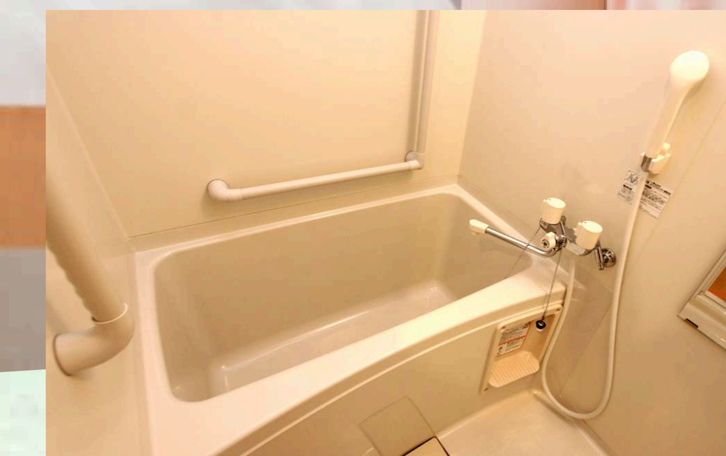
手すり付きのお風呂